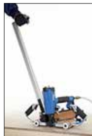
Standgriff (Art. Nr. 14412429)