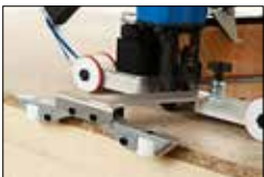
Kantenanschlag (Art. Nr. 14412428)